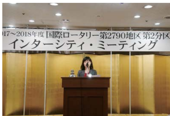
I.M. 発表 水庫会長エレクト