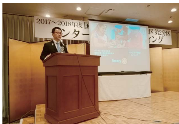
I.M. 地区より 財団委員発表