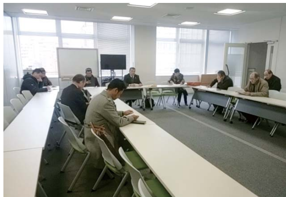
裁判所見学レクチャー

私もまた、身の丈にあった方法で、人に好かれるようにいつかなれたらと思っております。